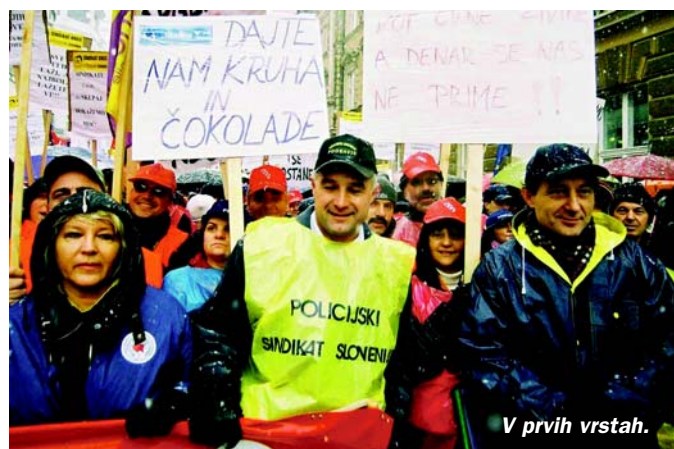
V prvih vrstah.