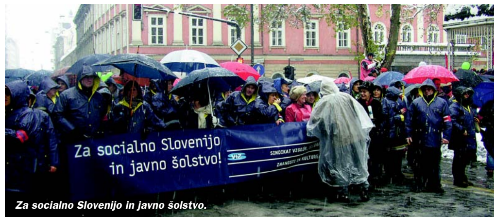
Za socialno Slovenijo in javno šolstvo.