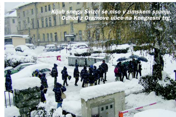
Kljub snegu Svizci se niso v zimskem spanju. Odhod od Oraznove ulice na Kongresni trg.