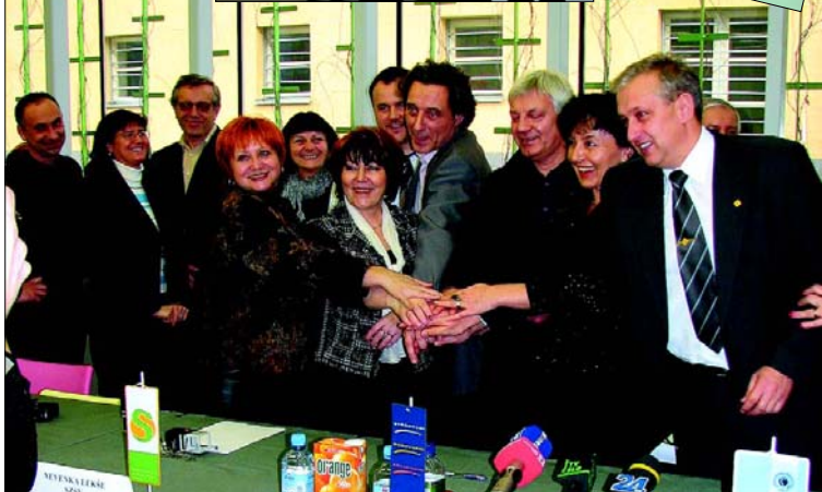
Podpis akta o ustanovitvi konfederacije sindikatov javnega sektorja - Predstavniki petih sindikatov, ustanoviteljev Konfederacije sindikatov javnega sektorja, podpisujejo Akt o ustanovitvi konfederacije. Nova konfederacija pomeni pomemben prispevek k povezovanju predstavnikov zaposlenih, kar je pred napovedanimi velikimi socialnimi in gospodarskimi reformami ključnega pomena za uveljavljanje interesov zaposlenih v javnem sektorju.