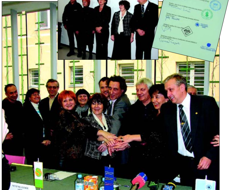
Podpis akta o ustanovitvi konfederacije sindikatov javnega sektorja - Predstavniki petih sindikatov, ustanoviteljev Konfederacije sindikatov javnega sektorja, podpisujejo Akt o ustanovitvi konfederacije. Nova konfederacija pomeni pomemben prispevek k povezovanju predstavnikov zaposlenih, kar je pred napovedanimi velikimi socialnimi in gospodarskimi reformami ključnega pomena za uveljavljanje interesov zaposlenih v javnem sektorju.