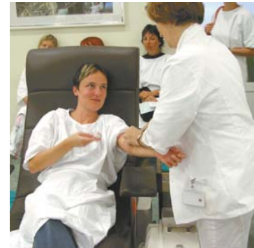
Med prvimi so prav na svetovni dan učiteljev navsezgodaj zjutraj darovali kri članice in člani z območnega odbora Ljubljane in okolice.

Tudi letos smo se v Svizu ob 5. oktobru, svetovnem dnevu učiteljev, odločili, da članice in člani pozovemo k darovanju krvi. Tako se odzivamo na splošno pomanjkanje krvi pri nas in uredništvu tudi medsebojno solidarnost, ki jo imamo zapisano v naših načelih in ciljih. Krvodajalske akcije v organizaciji Svizovih območnih odborov potekajo po vsej državi ves oktober in tudi še novembra.