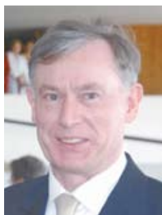
Horst Köhler, nemški predsednik

Na vsakem kongresu sta podeljeni priznanji - prvo (Albert Shanker Education Award) dobijo vzgojitelji ali učitelji, ki v izobraževanje prinašajo izjemne dosežke,